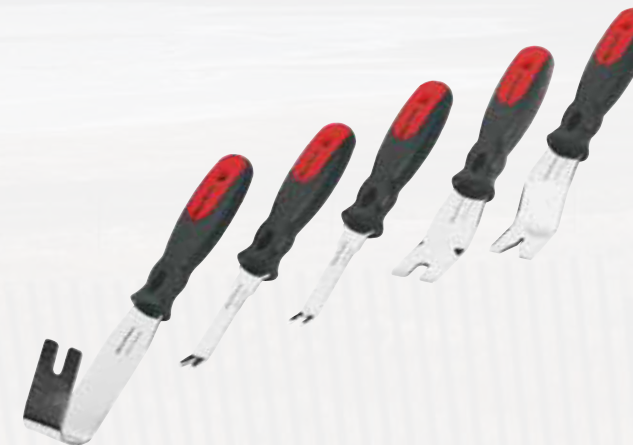
UTS105A Verkleidungswerkzeug-Set, 5-teilig. Set beinhaltet 5 in Form und Größe verschiedene Werkzeuge. Für Türverkleidungen, Zierleisten, Armaturenbretter und andere diverse Kunststoffclips.