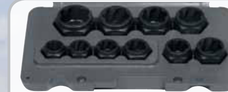
110STSZA 3/8" Turbonussleiste, extra kurz. 10-19mm. Durchgehendes, extra kurzes Design für lange Schrauben und Stehbolzen sowie enge Arbeitsbereiche. Der Außensechskant gewährleistet die Anwendung eines Ring-Gabelschlüssels mit der SW 16, 19, 24 und 27mm. Zum Ausdrehen von verschlissenen Inbus-, Torx-, Vielzahn- und Sechskantschrauben.