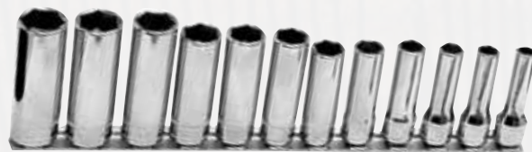
212SFSMY 3/8" Nussatz, 12-teilig. Tiefe Ausführung, Sechskant, 8-19 mm, extrem dünnwandig, Flank Drive System für abgerundete Schrauben.