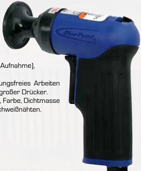
AT401MCA Mikroschleifer. Scheiben-Ø 50mm (3M Aufnahme), 15.000 U/min. Komfortgriff für ermüdungsfreies Arbeiten und gegen kalte Finger, großer Drücker. Zum Entfernen von Rost, Farbe, Dichtmasse sowie Bearbeiten von Schweißnähten.