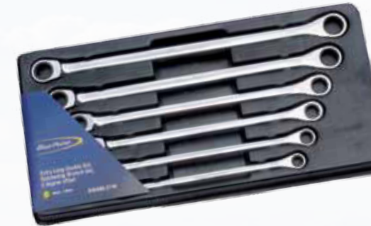
BOERMLS706 Ratschenschlüsselset, extra lang. Feinverzahnt (5°), Hochleistungsratschenmechanismus mit spherical Multiprofil passt auf 6 verschiedene Schraubenköpfe. 8-19 mm. 5-teilig.