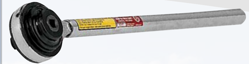
GA184A Drehmomentvervielfältiger (1:3,4). 1/2" Eingangsvierkant - 3/4" Ausgangsvierkant, Eingangsdrehmoment 340 Nm-Ausgangsdrehmoment 1.350 Nm. Robustes Anzugs- und Lösewerkzeug für hochfeste Schraubverbindungen (z.B. Riemenscheiben, Achswellen, Kettenplatten etc.).