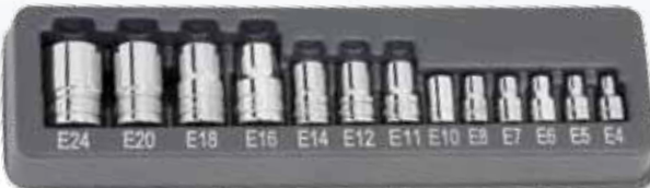
213AFLEY Außentorx Nussatz, 13-teilig. E4-E24, 1/4" (E4-E8), 3/8" (E10-E18) und 1/2" E16-E24. Dünnwandig für enge Arbeitsbereiche.