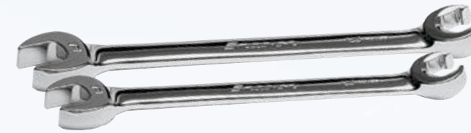
FLANK DRIVE RXSM1011BSET Gabel-Bremsleitungsschlüsselset. 2-teilig (10 und 11mm). Flank Drive System für abgerundete Verschraubungen.