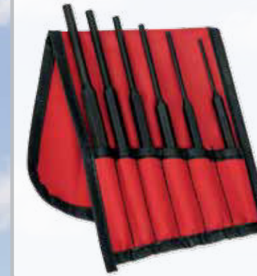
PPCM60BK Metrischer Durchschlagssatz. 3-8mm, 6-teilig.