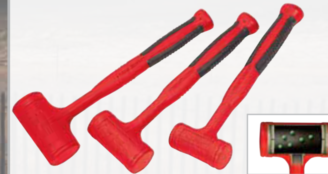
HBFE103 Schonhammersatz, rückschlagfrei. 3-teiliges Hammerset (680g, 900g, 1.360g). Schonhammer für beschädigungsfreies Arbeiten. Mit Kunststoff ummantelter Hammerkörper mit Stahlkugelfüllung. Temperaturbeständig von -20 °C bis +90 °C.