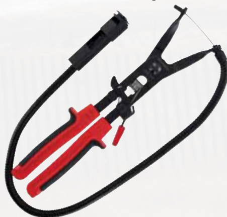
SHCP1-R Schlauchschellenzange. Für die 3 gängigsten Schlauchschellenarten. Ergonomischer Griff. Kabelaufnahme im Griff gewährleistet die Fixierung des Bowdenzugs für eine effiziente Lagerung der Zange. Ratschenarretierung für einfache und sichere Arretierung der Schellen.