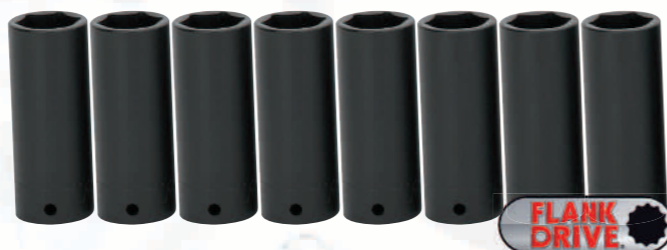
SIMMSET12 1/2" Schlagnussset. Tief, 6-kant, mit den Größen 21, 22, 24, 27, 30, 32, 33 und 36mm. Flank Drive System für abgerundete Schrauben.