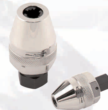
ITCSTUD-PK2 Stehbolzenausdreher-Set, 2-teilig. 1/4" Stehbolzenausdreher für 2-7mm 3/8" Stehbolzenausdreher für 6-12.5mm Robustes Design für die Anwendung mit Schlagschrauben.