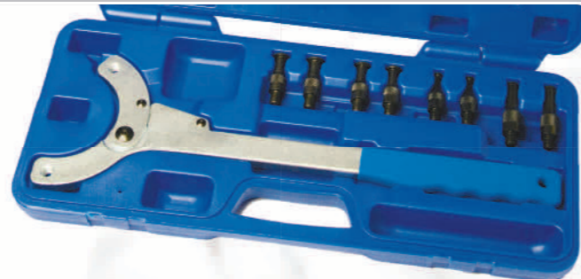
ITCACP Einzigartiges, einstellbares Nockenwellen- Arretier-Werkzeug. Einstellbarer Ø von 30- 150mm. Federbelastung gewährleistet eine einfache Einstellung. Speziell gefräste Bolzen gewährleisten den sicheren Halt des Nockenwellenrades beim Lösen bzw. Festziehen des Zentralbolzens der Nockenwelle (Ø 7, 10, 14 und 16mm). Auch zum Arretieren des Nockenwellenrades für diverse Einstellarbeiten geeignet.