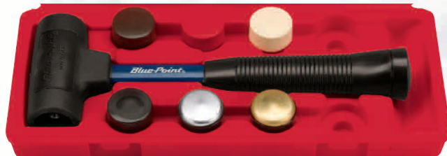
HSPI6KT Hammerset, rückschlagfrei (625g). 7-teiliges Set mit 6 Wechselköpfen in Stahl, Messing und Kunststoff mit verschiedenen Härtegraden.