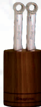
BOERMKNIFE Set besteht aus: Ratschen-Ring-Gabelschlüsselsatz 8-19mm. Hochleistungs-Ratschenmechanismus mit Flank Drive System für abgerundete Schrauben Steakmesserset, 6-tlg. Rostfreier Edelstahl. Snap-on-Logo im Griff. Edler Holzblock zur Aufbewahrung.