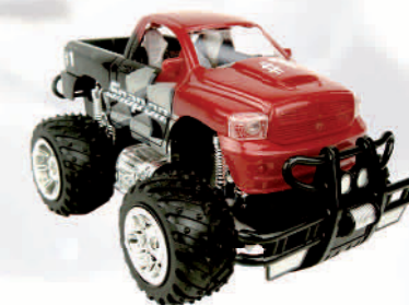
Ferngesteuerter Monster-Truck im Snap-on Design. Größe: 23,5 x 14,5 x 11,5, Maßstab: 1:18, mit Licht.