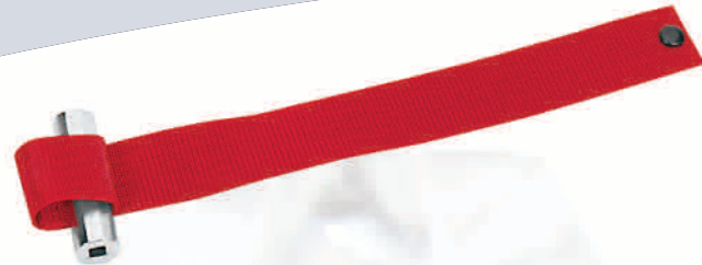
A91E Filterband mit 3/8" und 1/2" Antrieb. Für Filter mit Ø von 25-150mm geeignet.