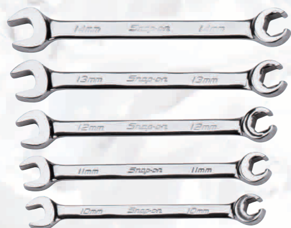
RXSM605B Gabel-Leitungsschlüsselset von 10-14mm. Flank Drive System für abgerundete Verschraubungen. Hervorragend für abgerundete Leitungsverraubungen jeglicher Art geeignet (Bremsleitungen etc.).