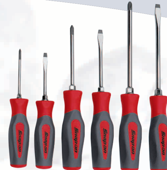
SHDXTRUCK Set besteht aus: Schraubendrehersatz. Mit neuartigem Instinct™ Griff für mehr Drehkraft mit höherem Komfort, gemischt, 6-teilig, 3x Schlitzklinge, 3x Phillipsklinge (#1,#2,#3).