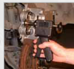
Schwimmender Bremsattel mit Doppelkolben

BTCP1 Bremskolben-Rücksetz-Werkzeug. Für starre und schwimmende Bremsättel. Die Platten sind um 180° drehbar und gewährleisten somit eine rechts- oder linksseitige Anwendung. Bietet eine Kraft von 7.117N (726kg).